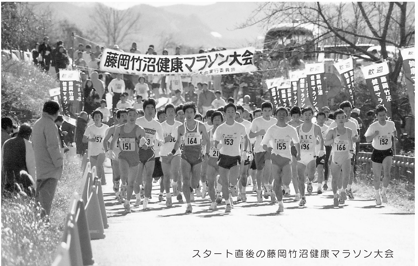
スタート直後の藤岡竹沼健康マラソン大会